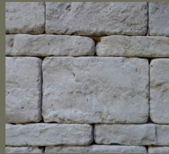
JURA KALKSTEIN, antik getrommelt