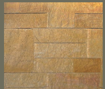
WARTHAUER SANDSTEIN, gespalten