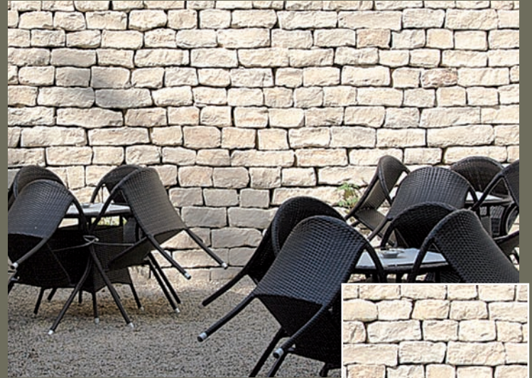
JURA MAUERSTEINVERBLENDER, gespalten

Eine große Auswahl heimischer Natursteine aus unseren Steinbrüchen ermöglicht auch eine Vielzahl individueller Lösungen.