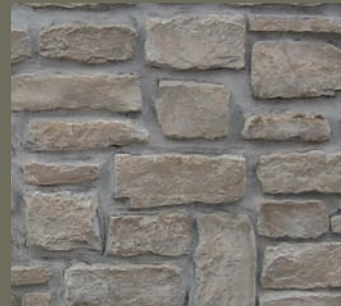
JURA KALKSTEIN RUSTIKAL, gespalten