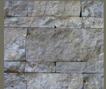
PFRAUNDORFER DOLOMIT, gespalten