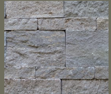
KIRCHHEIMER MUSCHELKALK, gespalten