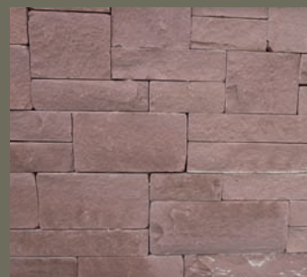
EICHENBÜHLER SANDSTEIN, antik getrommelt