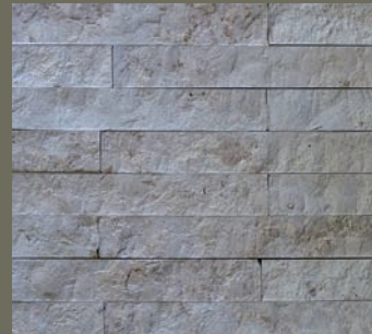
JURA KALKSTEIN, gespalten